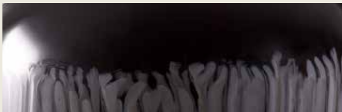
Cristallo di Murano battuto